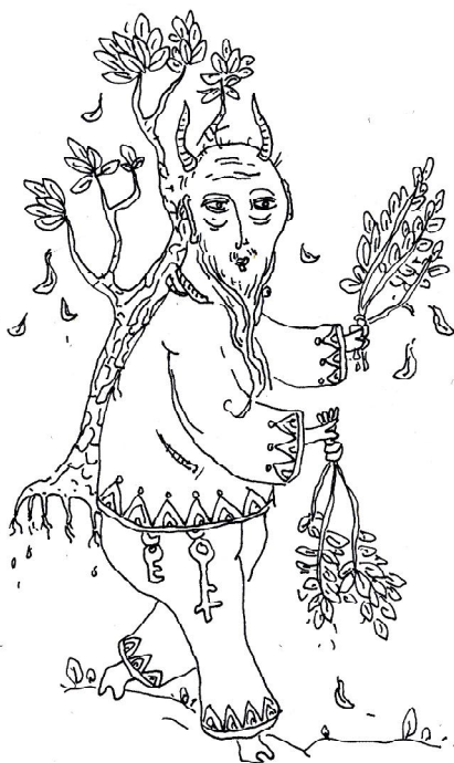
Леший принимает образы